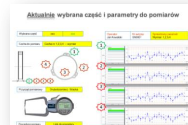
System Stosowany w Naszej Firmie