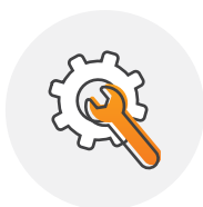
Przemysł i usługi