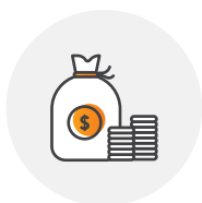
Finanse i ubezpieczenia

Badamy potrzeby rynku, identyfikujemy problemy, dopasowujemy rozwiązania do specyfiki konkretnej branży.