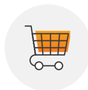
FMCG i farmacja